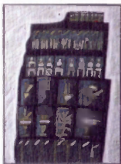
Louis Seror "La montagne magique" 2003 Acrylique et encre de chine sur papier marouflé sur toile 100 X 81 cm Collection Véron & Associés