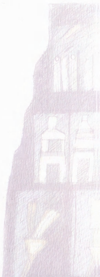
Louis Seror "La montagne magique" 2003 Acrylic and Indian ink on paper mounted on canvas 100 X 81 cm Véron & Associés collection