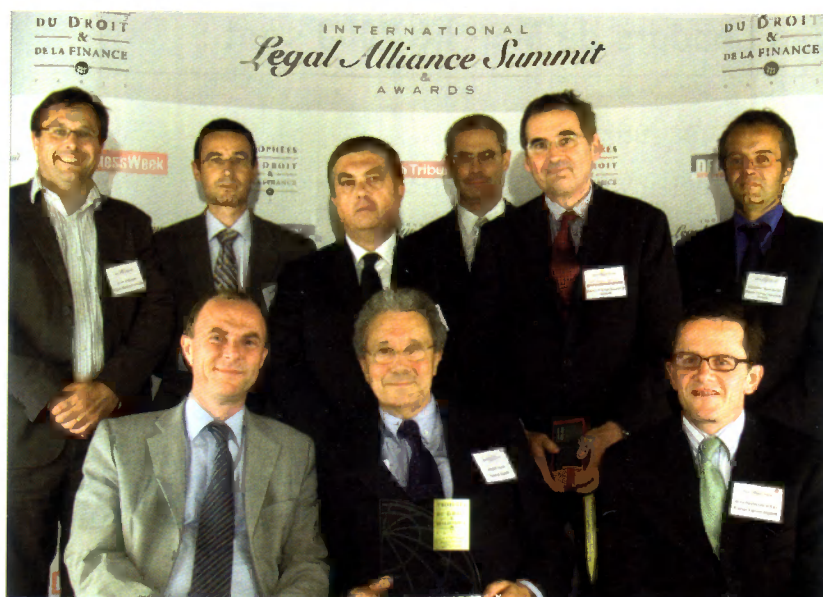
Les acteurs distingués 2008 (Trophées d'or et d'argent)