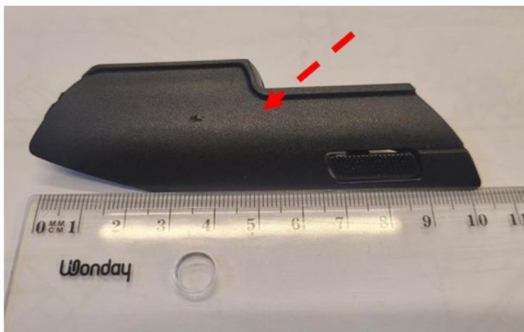
Figure 73 : adaptateur MOPAR (flèche rouge, photo du haut) et adaptateur BYD (flèche orange, photo du bas) positionnés à côté d'une règle graduée de manière à faire apparaître leurs dimensions longitudinales identiques